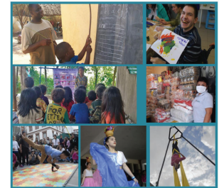
Interviews at the Frontline of Working with Children at Risk Globally