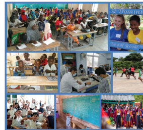
Perspectives from National Leaders