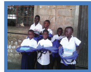
Celebrating Educators and Working Together for the Global Compact on Education