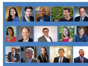
Volume 1: North America