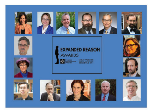
Interviews with Expanded Reason Awards Recipients